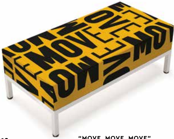
18 "MOVE, MOVE, MOVE"