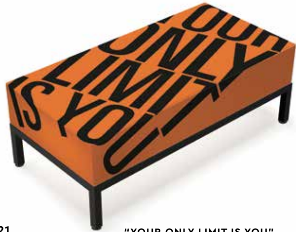
21 "YOUR ONLY LIMIT IS YOU"