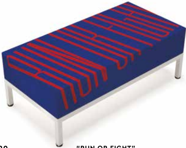
20 "RUN OR FIGHT"