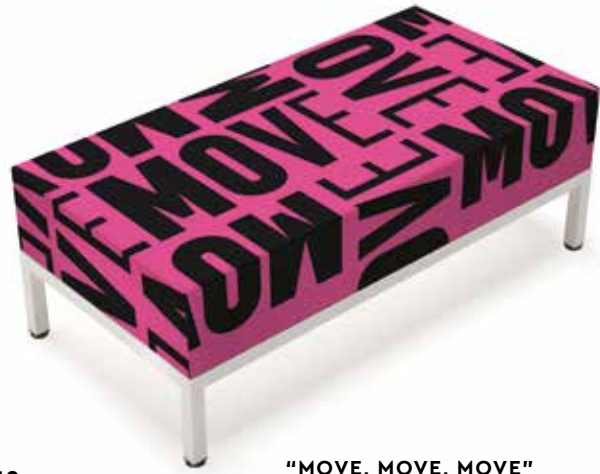
19 "MOVE, MOVE, MOVE"